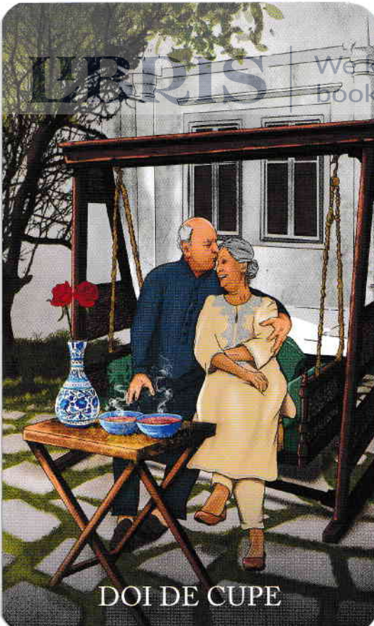
DOI DE CUPE