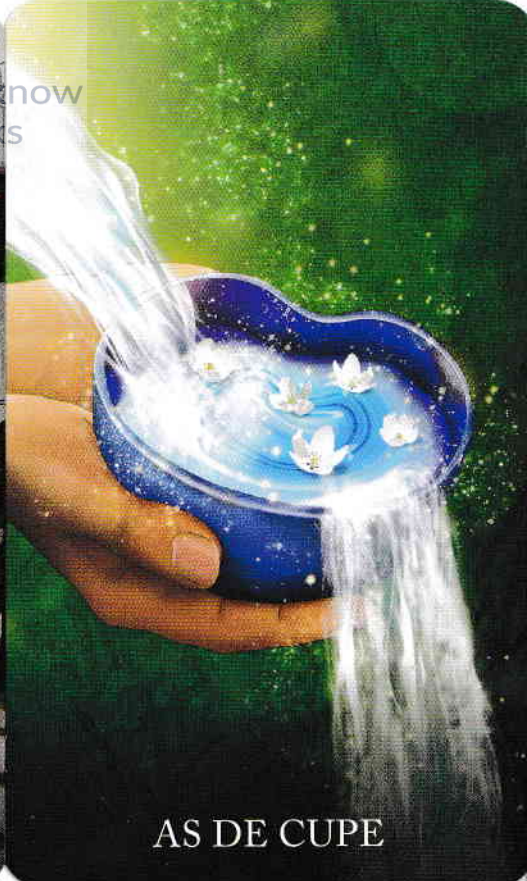
AS DE CUPE